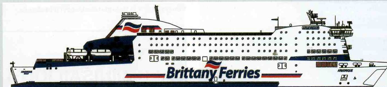
Ropax-färjan Amorigue i januari 2009 från Sandviken

Ropax-färjan Amorigue är det sista nybyggda fartyget från Helsingfors varvet; Brittany Ferries tog leverans i januari 2009. Sähär i FNB-pessmeddelande från juli i år: Det är lugnt vid STX varv i Hfors. Inga fartyg syns till och det vanligen mycket livfulla området ligger öde. Skeppsbyggarna är, med undantag av några anställda vid huvudkontoret, permitterade. Ett fåtal arbetare har också förflyttats till Åbo. /Norerar även tidningsrubrik i augusti: Oljebekämpningsfartyget Halli från Pansio i Åbo skall repareras vid STX Helsingfors varvet.